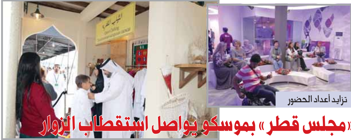
تزايد أعداد الحضور