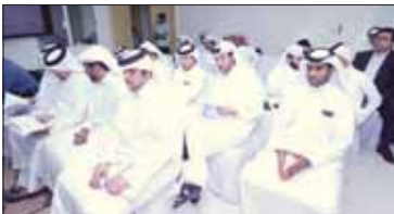
■ جانب من الحضور