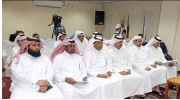
■ أعضاء الجمعية

حول أسباب تراجع نتائج الفئات السنوية للنادي، ودعا مجلس الإدارة إلى إيجاد الحلول اللازمة للمسألة عبر تحقيق الاستقرار المطلوب في الأجهزة الفنية لمختلف الفئات، وجلب أكثر ما يمكن من لاعبين لممارسة اللعبة، وتوفير رصيد بشري يذكي التنافس داخل الفئات. وتناولت بقية التدخلات موضوع تنمية الموارد المالية للنادي، عبر استكمال مشروع تركيز المحلات في المحيط الخارجي للنادي. وأوضح الشيخ حمد بن ناصر آل ثاني رئيس النادي في رده على تساؤلات الأعضاء، أن النادي قد حصل على الموافقة المبدئية لاستخدام المحيط الخارجي