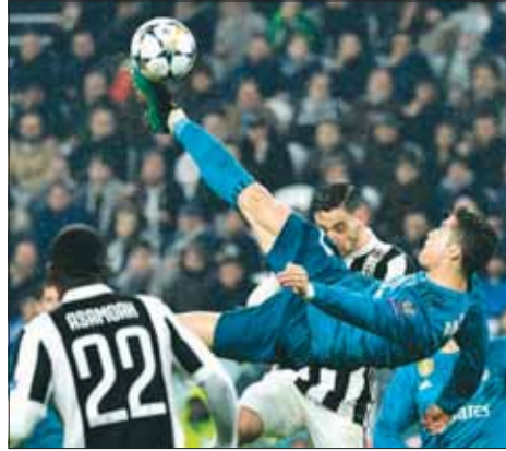
■ لحظة هدف رونالدو في شباك اليوفي بقميص ريال مدريد

«ليس لدي سوى شعور كبير بالشكر لهذا النادي وللمشجعين والمدينة»، مضيفاً: «أطلب من الجميع وخصوصاً مشجعيينا أن يتفهموني».