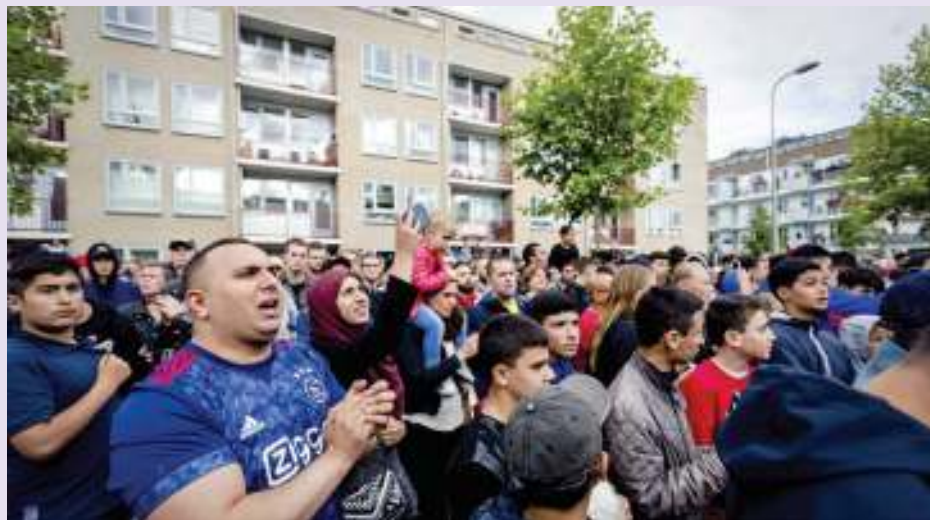
جماهير أياكس تحتشد أمام منزل نوري

وأردف كاييز: «أعتقد أن اللاعبين بدأوا في العودة إلى الوضع المعتاد رغم أن ذلك يستغرق وقتاً. لكن لا بد لنا من العودة