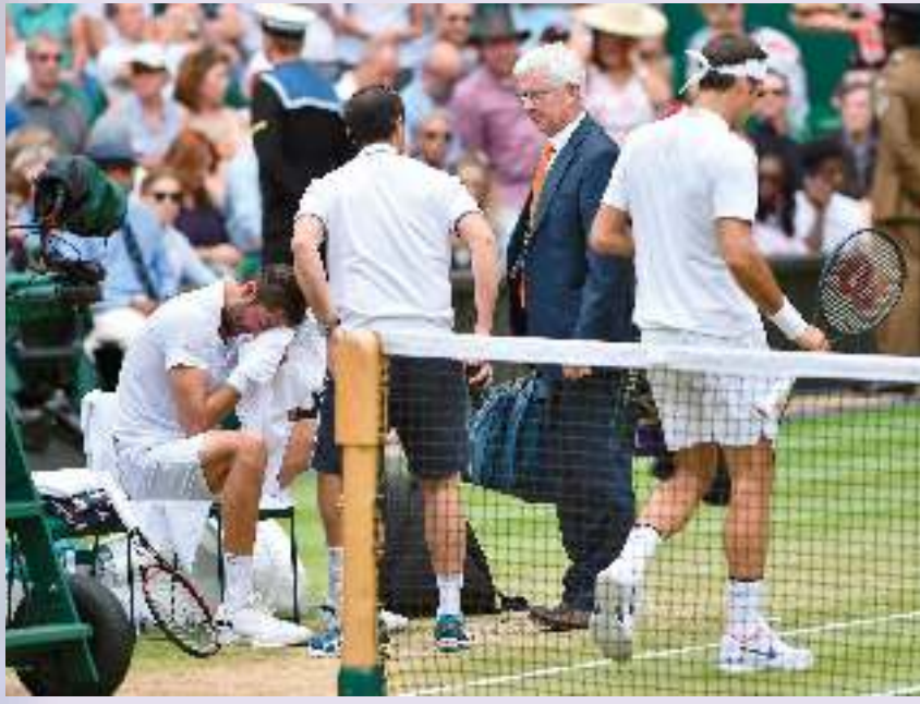
سيليتش يبكي بعد إصابته

انفرد السويسري روجيه فيدرر بالرقم القياسي لعدد القاب بطولة ويمبلدون الإنجليزية - ثالث البطولات الأربع الكبرى في كرة المضرب - بإحرازه لقبه الثامن أمس، على حساب الكرواتي مارين سيليتش. وتفوق فيدرر (35 عاماً) المصنف ثانياً في النهائي على الكرواتي - المصنف سابعاً - 6 - 3، 1 - 6، و 4 - 6. ليصبح أكبر لاعب يحز لقب البطولة المقامة على ملاعب عشبية منذ بدء تطبيق نظام الاحتراف عام 1968، ومعززاً رقمه القياسي في عدد بطولات «الفراند سلام» بلقب تاسع عشر. وفي النهائي الحادي عشر له على ملاعب نادي عموم إنجلترا، أحرز فيدرر لقبه الأول في ويمبلدون منذ 2012، وثاني لقب كبير له في 2017، بعد بطولة أستراليا المفتوحة في يناير، وطبعت المباراة دموع اللاعبين.. فيدرر بعد حسمه اللقب، وسيليتش (28 عاماً) في الأجزاء الأولى من المجموعة الثانية - بعيد استدعائه المعالج الفيزيائي إثر تأخره بنتيجة 0 - 3.