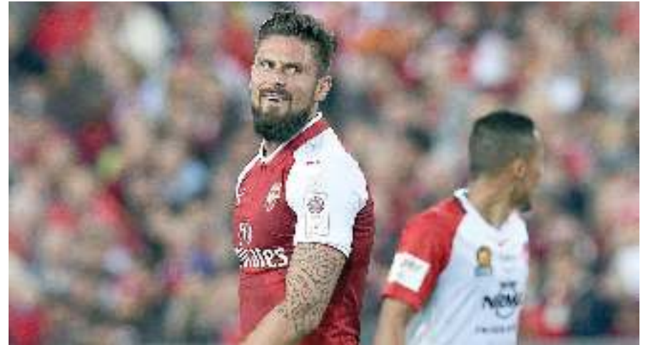
جيرو في مباراة ويسترن سيدني

وكان جيرو «30 عاماً» الذي سجل 12 هدفاً في 29 مباراة مع النادي اللندني في الدوري الإنجليزي الممتاز الموسم الماضي. قد أعلن قبل أيام أنه «لا يعرف» ما إذا كان سيبقى مع أرسنال بعد ضم لاكازيت. وأعلن نادي ليون الفرنسي، في الخامس من يوليو الحالي، أن لاعبه لاكازيت «26 عاماً» - الذي دافع عن ألوانه منذ العام 2010 - انتقل إلى أرسنال في صفقة، قد تصل إلى 60 مليون يورو.