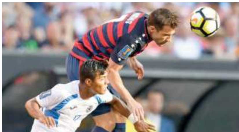
من مباراة الولايات المتحدة ونيكاراجوا

وكتندا، المتأهلتين من المجموعة الأولى، إضافة إلى هندوراس، كأحد صاحبي أفضل مركز ثالث.