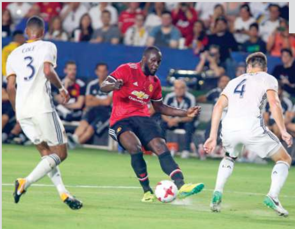
حصار على لوكاكو في اللقاء

وحسمت المباراة تقريباً، بعد أن أحرز ماركوس راشفورد، هدفين للفريق الضيف في أول 20 دقيقة، قبل أن يضيف زملاؤه: مروان فيليني وهنريخ مخيتاريان وانطوني مارسيال، بقية الأهداف. وقلص أصحاب الأرض الفارق قبيل النهاية بهدفين، حملاً توقيع جيوفاني دوس سانتوس، وديف رومني.