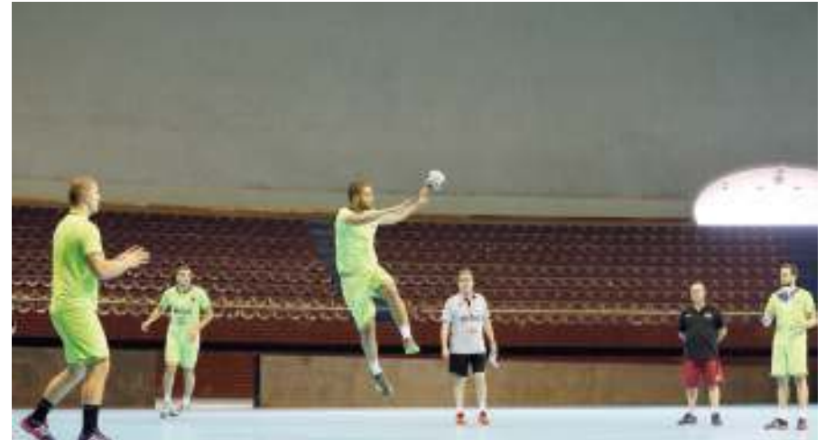
العنابي يتدرب بالجزائر

هذا، وقد خصص مدرب العنابي -الإسباني فاليروا- أمس الأحد حصة فيديو للاعبين بالفندق الذي تقيم فيه بعثة منتخبنا، من أجل تصحيح الأخطاء التي ظهرت على أداء اللاعبين في المواجهات الودية الأخيرة أمام كل