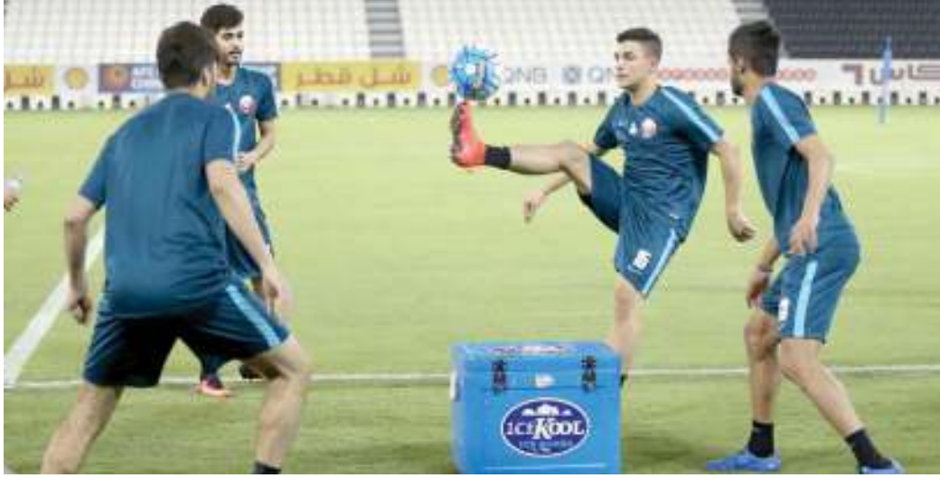
العنابي يتدرب في السد أمس

أعلن الجهاز الفني للعنابي الأولمبي عن القائمة النهائية للمنتخب المكونة من 23 لاعباً، التي ستخوض منافسات المجموعة الثالثة من تصفيات كأس آسيا لأقل من 23 سنة، المقرر أن تقام في الدوحة من 19 إلى 23 يوليو الحالي، بمشاركة منتخبات الهند وتركمانستان وسوريا وقطر البلد المنظم.