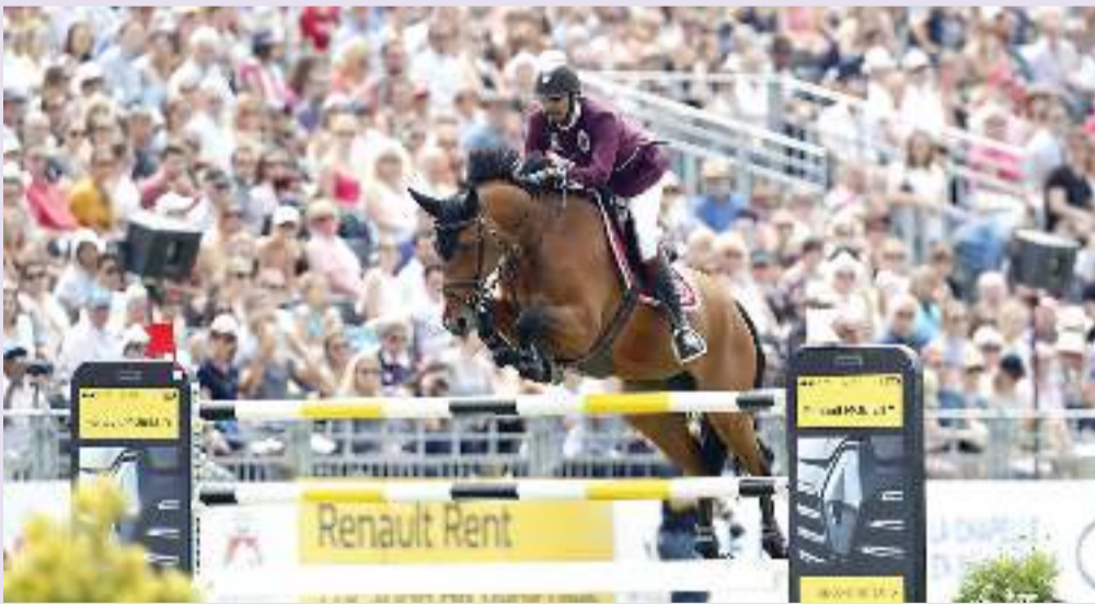
الشيخ علي بن خالد في حتام شانتيلي