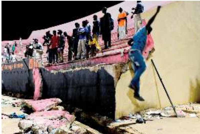
جماهير في الملعب بعد الأحداث

وكان ستاد ديمبا-ديوب مكتظاً بالمشجعين الذين جاؤوا لحضور المباراة بين فريقين سنغاليين «أوكام» و«ستاد مبور» في هذه المباراة النهائية التي كانت منتظرة جداً، وخلال الوقت الإضافي، وبينما كانت النتيجة 1-2 لصالح ستاد مبور، بدأ مشجعو الفريق الآخر رشق مشجعي ستاد مبور