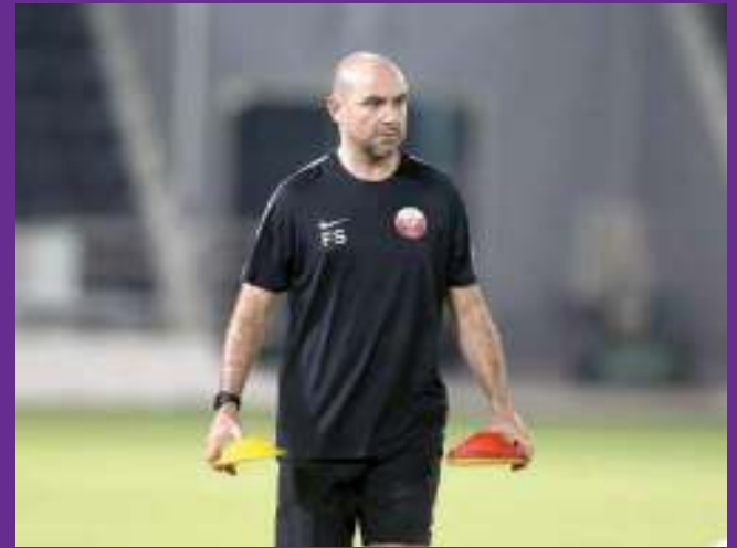
تدريب العنابي الأولمبي