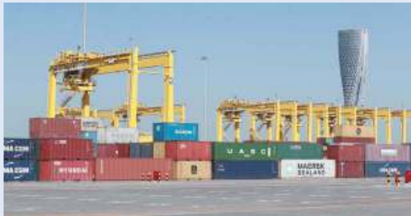
ألمانيا أكبر مصدر للسوق المحلي

وبالمقارنة مع شهر مايو عام 2016، ارتفعت قيمة صادرات أهم المجموعات السلعية المتمثلة في «غازات النفط والهيدروكربونات الغازية الأخرى» والتي تمثل (الغاز الطبيعي المسال والمكثفات والهيدروكربونات والبيوتان، إلخ..) لتصل إلى نحو 12.0 مليار ريال، وبنسبة 21.6%، وارتفعت قيمة صادرات «زيوت» نفط وزيوت مواد معدنية قارية خام، لتصل إلى ما يقارب 3.3 مليار ريال وبنسبة 8.3%، وارتفعت قيمة صادرات «زيوت نفط وزيوت متحصل عليها من مواد معدنية قارية غير خام» لتصل إلى نحو 1.1 مليار ريال، وبنسبة 29.7%. وخلال شهر مايو عام 2017، جاءت مجموعة «عنفات نفثا»