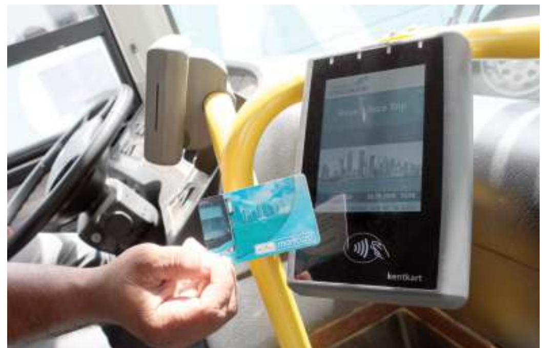
تيسير شراء وإعادة تعبئة بطاقات كروة الذكية