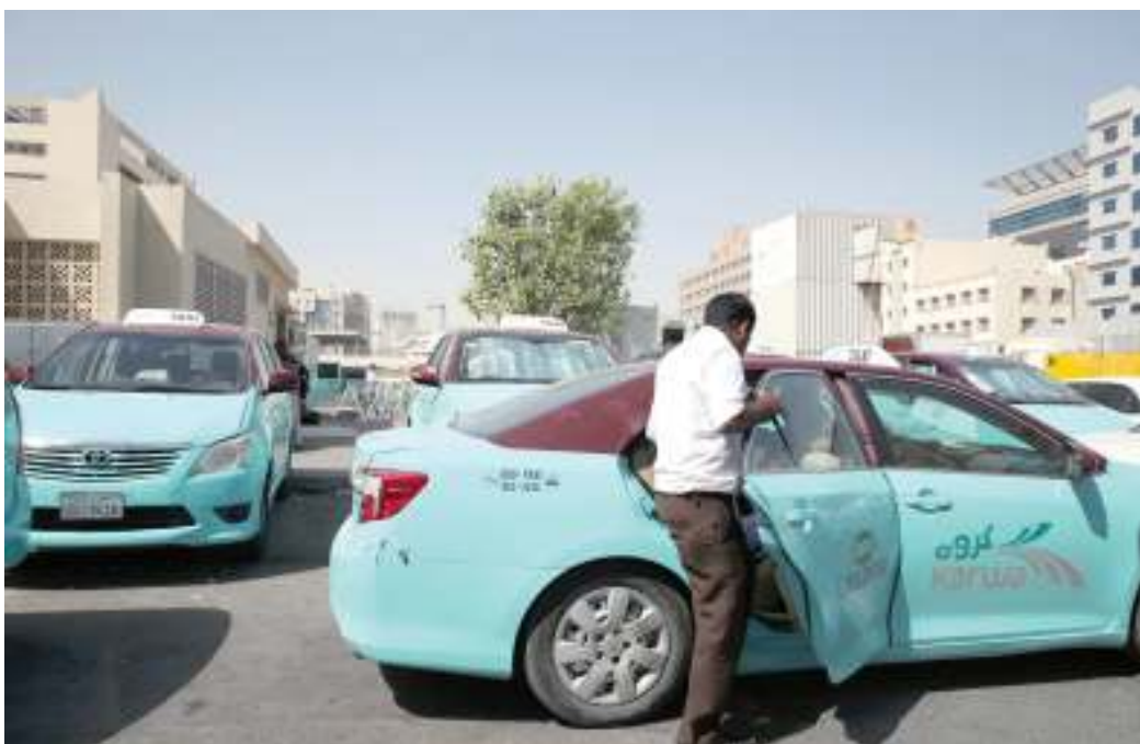
أسطول سيارات الأجرة يليي الطلب المتزايد