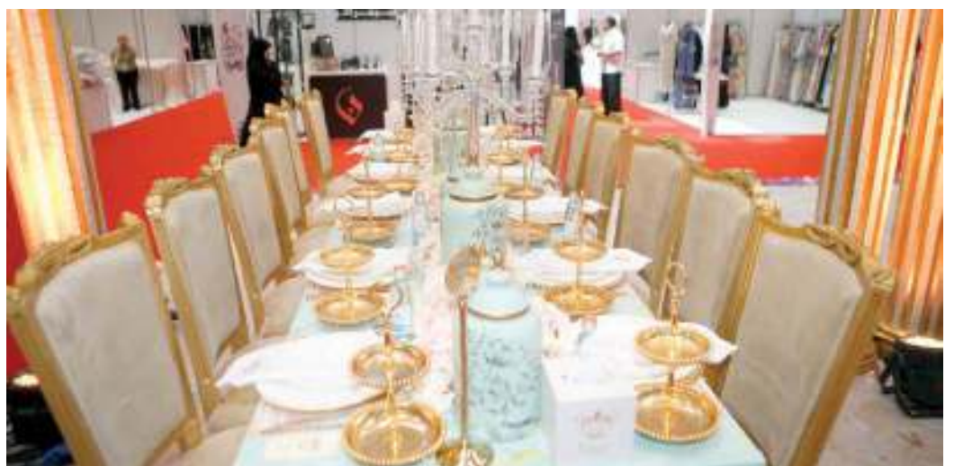
بحث الموطون عن لمسة فريدة بتجهيزات حفل الزواج