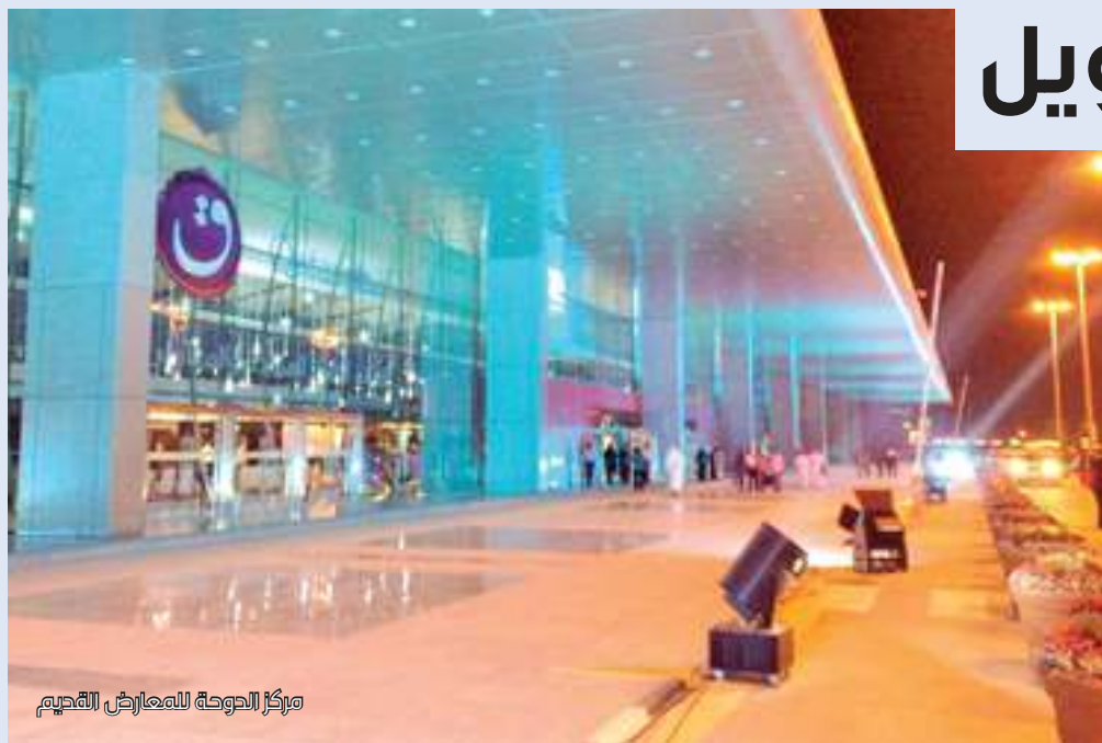
مركز الدوحة للمعارض القديم

المساحة الإجمالية للأرض المطروحة للاستثمار 84,875 متراً مربعاً