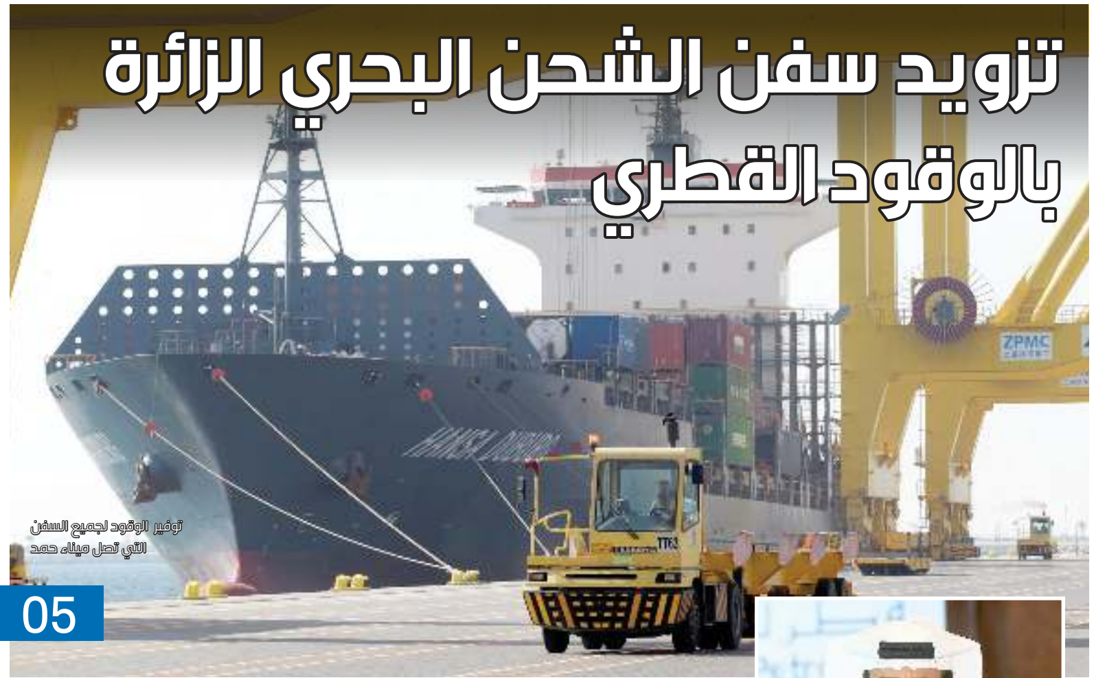
توفير الوقود لجميع السفن التي تصل ميناء حمد

بعد استيفاء جميع المعايير الدولية للسلامة البحرية. كما أعلنت «قطر للبترول» عن وصول أولى الشحنات التي تحمل زيت الوقود لأغراض تزويد سفن الشحن البحري بسلاسة إلى مرساها في ميناء رأس لفان. وستتم إدارة طلبات العملاء لتزويد السفن بالوقود وإدارة العمليات بالتعاون مع شركة وقود البحرية التابعة لشركة وقود. وهي