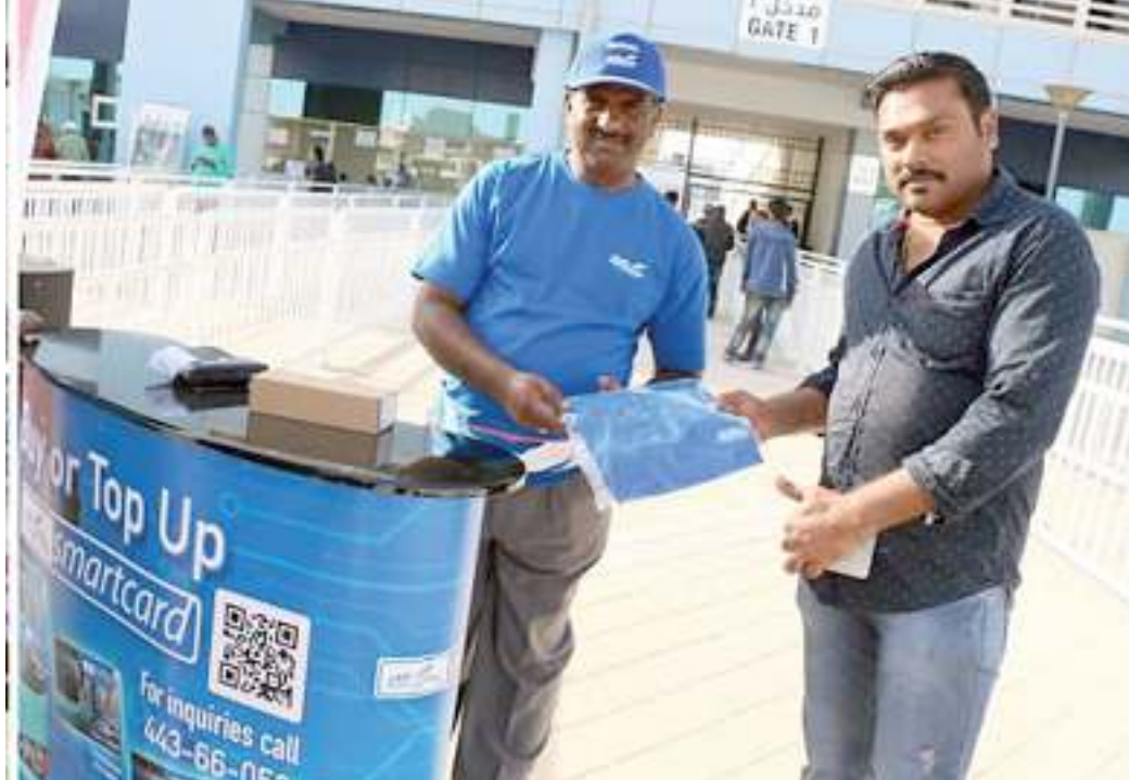
إجراء تعديلات على المسارات الحالية

كما أن مكتب شركة مواصلات بمنطقة الوصول بمطار حمد الدولي بجانب الأسواق الحرة يعمل على مدار الساعة لتوفير خدمة الركاب القادمين إلى الدوحة، وتلبية جميع احتياجاتهم من النقل.