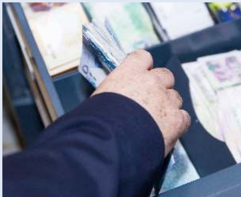
مؤشرات مالية وتجارية مريحة في مايو