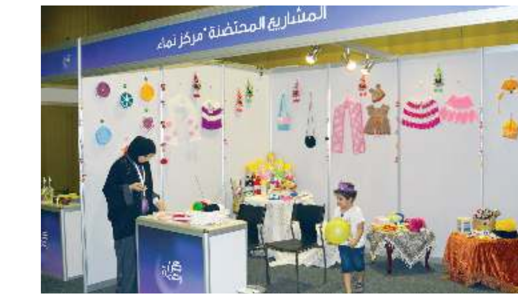
منتجات قطرية 100%

وأنها تقدم للأطفال عباءة خاصة بالصلاة بألوان زاهية لتشجيعهن على الصلاة، بالإضافة إلى حقائب خاصة لأغراض الأطفال، وثمنت رفعة مبادرة الغرفة في إشراك الأسر المنتجة بالسوق الخيرية بمهرجان «بشائر الرحمة للمرة الأولى، حيث يعتبر المهرجان التي تقيمه راف من أبرز الفعاليات الرمضانية، مؤكدة على نيتها المشاركة في النسخ القادمة للمهرجان، وتقديم بالشكر لمركز الإنماء الاجتماعي (نماء) على احتضان مشروعها. ولم يقتصر السوق الخيري على الجانب الاستهلاكي فقط؛ فقد كان للأعمال الخيرية جانباً مهماً حيث اصطفت عدد كبير من اللوحات الفنية للأطفال من خلال معرض (حكاية ريشة)، والذي يضم لوحات أطفال من سوريا تعبر عن آمالهم والأمهم في الظروف التي مروا بها، على أن يذهب ربع تلك اللوحات بعد بيعها عن طريق المزاد الخيري إلى الأطفال السوريين أنفسهم.