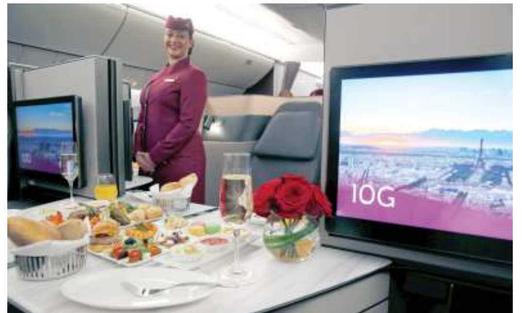
الابتكار والالتزام بتقديم أفضل وأرقى تجربة سفر