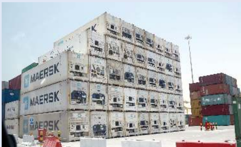
«ميرسك الدنمركية»، أكبر شركة حاويات في العالم

كانت «ميرسك» قد قالت في وقت سابق هذا الشهر: إنها ستقبل الشاحنات إلى قطر، عن طريق