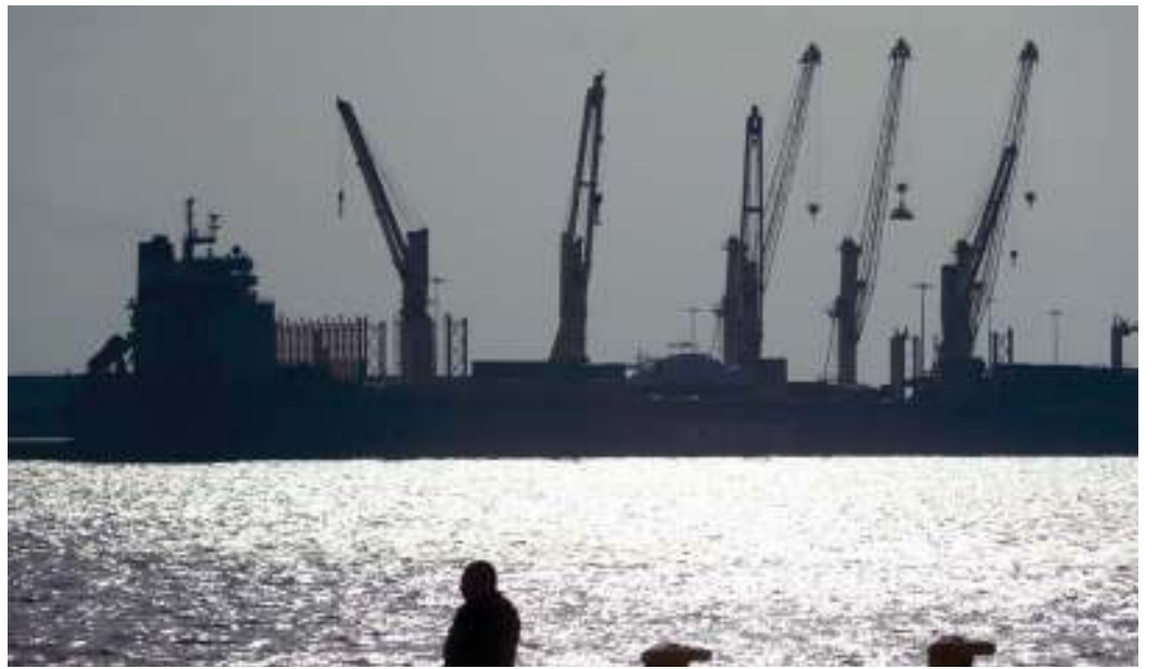
زيادة الاعتماد على الكفاءات القطرية