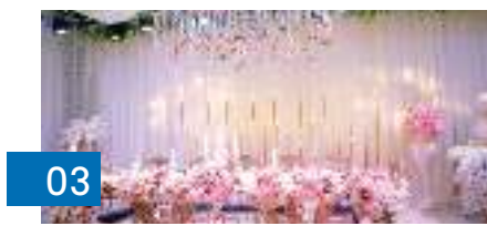
شركات تجهيز الأعراس تراهن على قرب حلول العيد