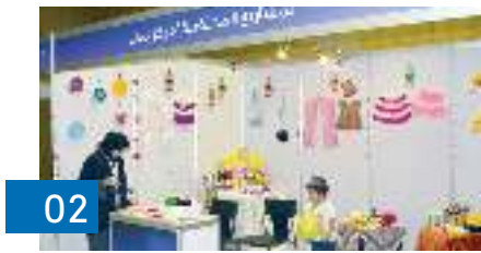
اختتام السوق الخيري لـ «بشائر الرحمة»