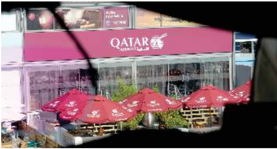
حضور بارز للناقلة بالمعرض

أخرى على سعي الخطوط الجوية القطرية الدؤوب نحو الابتكار والالتزام بتقديم أفضل وأرقى تجربة سفر للركاب.