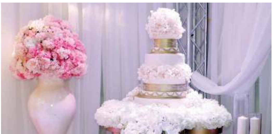
الشركات تقدم خيارات تناسب ميزانيات العملاء

وأشارت إلى أن الشركة تتربح انتهاء رمضان وحلول فترة الأعياد ومن بعدها بدء الموسم المدرسي حيث تصل الحجوزات والطلبات إلى ذروتها، رغم أنها كانت جيدة على مدار العام، لافتة إلى أن عدد الحفلات في 2017 حافظ على ثباته بالمقارنة مع العامين الماضيين، لافتة إلى أن قائمة المستلزمات التي يفضلها الزبون هي التي شهدت بعض التراجعات، كما أن الشركة تراعي جميع الميزات الخاصة بالعملاء، وتحاول مساعدتهم لاختيار ما يناسبهم، مؤكدة أنها تحضر إلى طرح عروض مشجعة للمقبلين على الزواج.