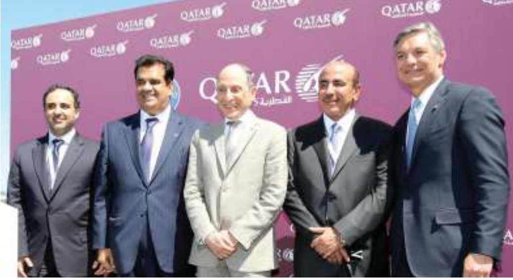
كبار الشخصيات خلال معرض باريس

كشفت الخطوط الجوية القطرية النقاب أمس، عن أول طائرة في أسطولها مزودة بالتجربة الجديدة للسفر على متن درجة رجال الأعمال - كيو سويت، والتي حصلت على جائزة مرموقة مؤخراً.