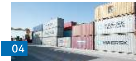
«ميرسك»: قرب بدء نقل الحاويات من عُمان إلى قطر