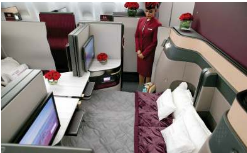
مرافق راقية في مقصورة درجة رجال الأعمال

وقال سعادة السيد أكبر الباكر الرئيس التنفيذي لمجموعة الخطوط الجوية القطرية: «يمثل معرض باريس الجوي 2017 المنصة الأمثل