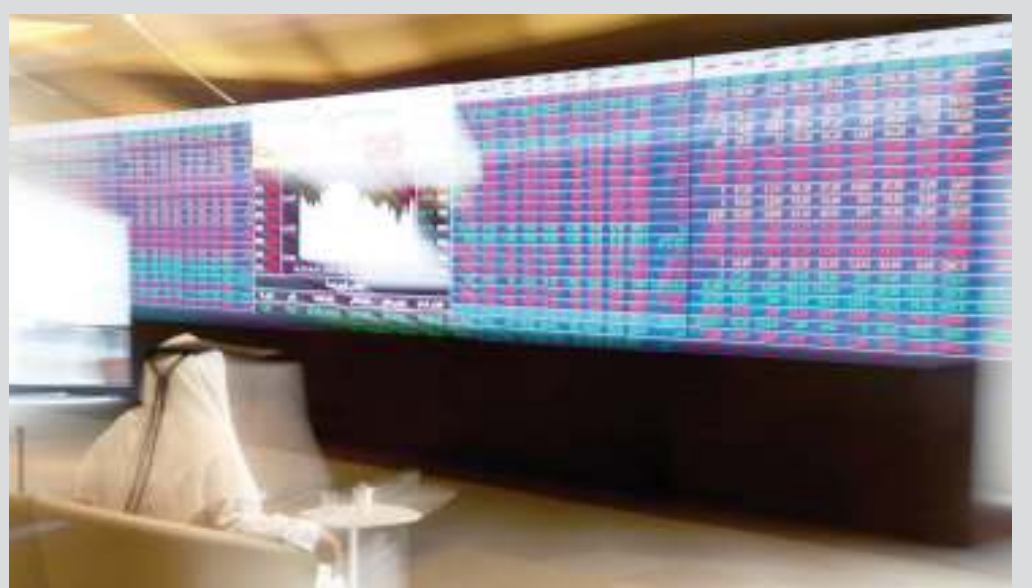
بورصة قطر تواصل التراجع

أنهى المؤشر العام لبورصة قطر جلسة يوم أمس على تراجع بـ 1.3%، مواصلاً انخفاضه لليوم الثاني على التوالي بضغط من أغلب الأسهم الكبيرة. وأنهى مؤشر ثاني أكبر أسواق المال العربية عند مستوى 9069 نقطة، وسط قيم