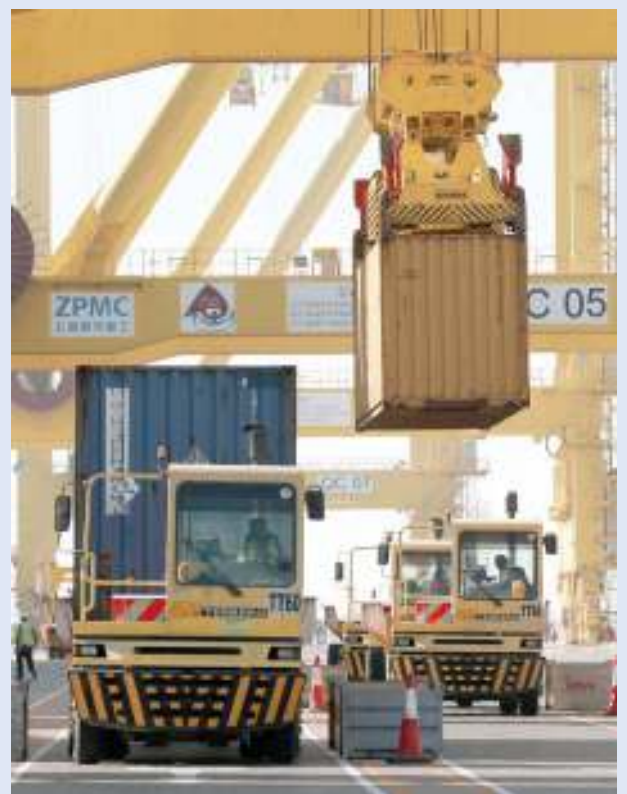
ميناء حمد يتعامل بكفاءة مع مختلف الواردات

ألمانيا والصين والولايات المتحدة الأميركية أبرز الدول المصدرة