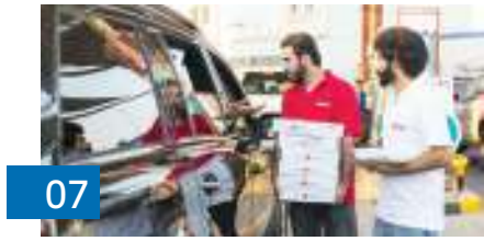
07 «ooredoo»: توزيع الإفطار في محطات البترول