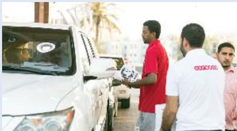
«ooredoo» تتخذ عدداً من المبادرات المجتمعية

لتنفيذ عدد من المبادرات المجتمعية خلال ما تبقى من الشهر المبارك. ويمكن للعملاء متابعة حملة ooredoo الرمضانية «بدأ بيد» عبر صفحتها على فيس بوك وإنستجرام وتويتر، و عبر الهاشتاق #شاركنا_اللحظة.