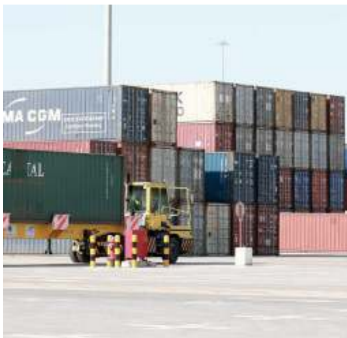
التعامل مع ملايين الحاويات سنوياً

لكن في ساحة التخزين في مسعيد القريبة، يقول المسؤولون: «توجد عشرة ملايين طن من صخور الجابرو المخصصة لأعمال البناء». كما صرح مسؤول الميناء بأن العمل يجري كالمعتاد.