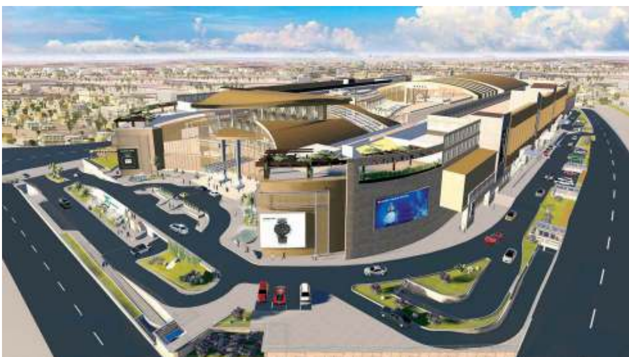
موقع متوسط يخدم جميع أنحاء الدوحة

وأوضح بأن الافتتاح الجزئي للمول، سيبترك هامشاً من الوقت أمام إدارته لتدارك الأخطاء التصميمية، أو النفاض الخدمة، التي لم تكن ظاهرة قبل دخول المول طور النشاط واستقبال العملاء، بما يسمح بتحسين خدمات المشروع، وتطويرها نحو الأفضل.