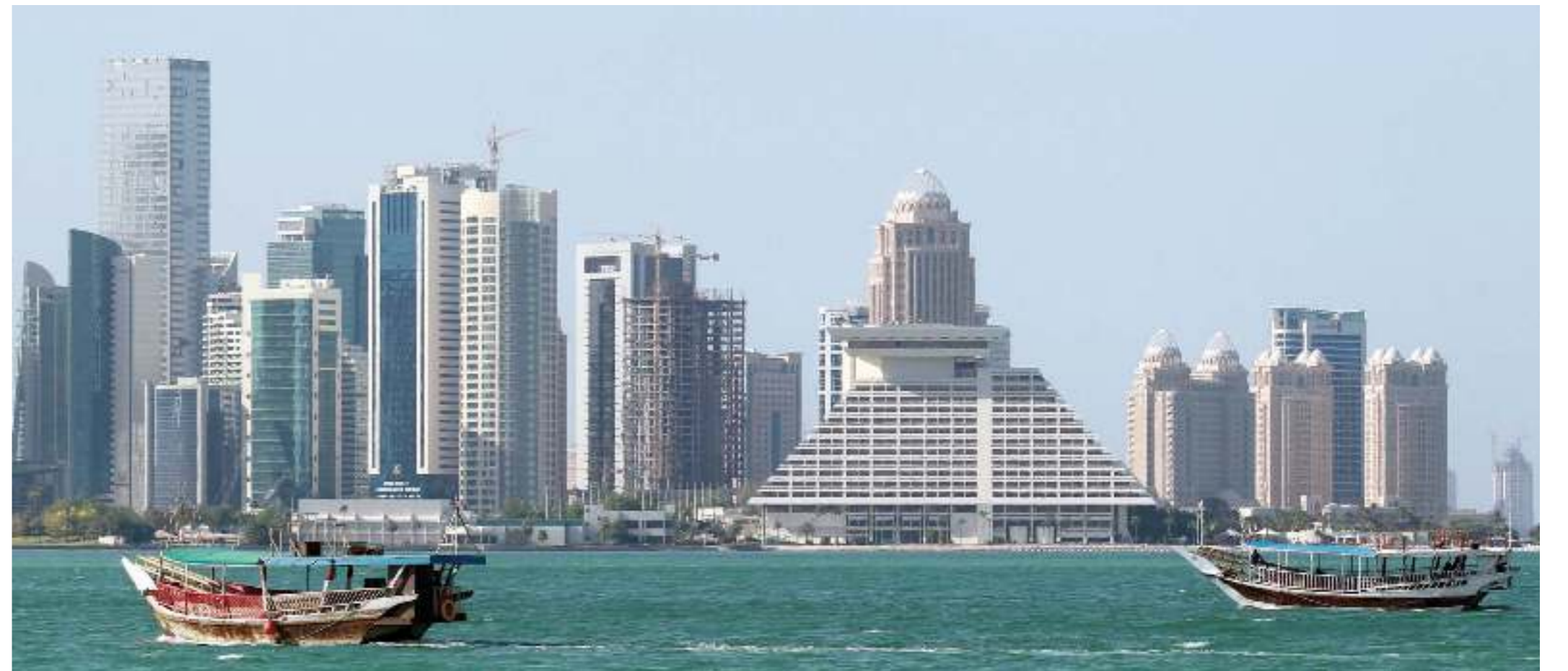
تنوع الموارد الاقتصادية لدولة قطر