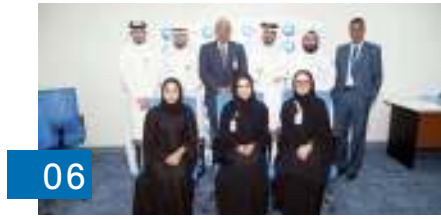
06 «المصرف» يطلق برنامجين للتطوير المهني السريع