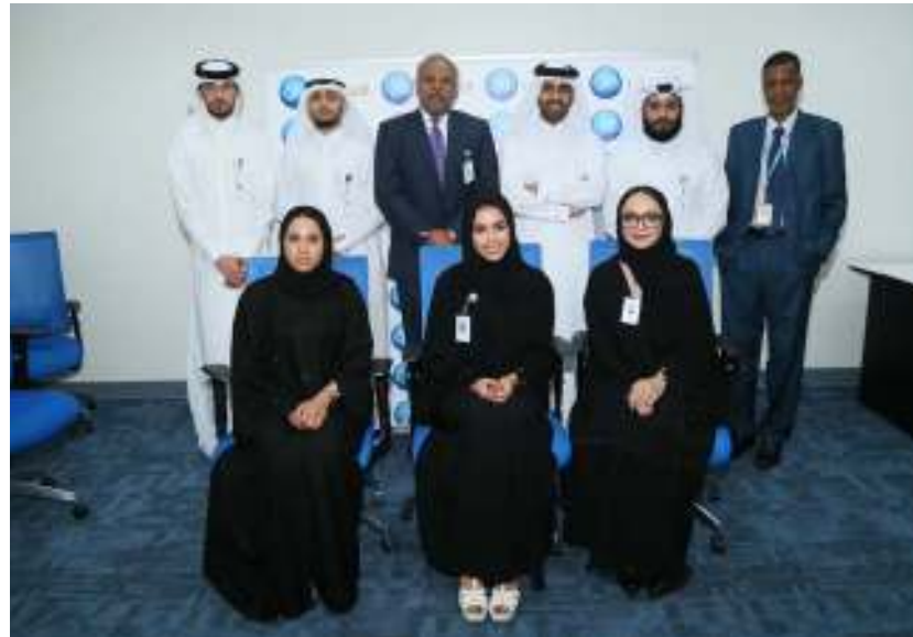
تعُد هذه المبادرة رائدة في مجالها

من المشاركين في البرنامج. ويشتمل البرنامج على العديد من المهارات والمفاهيم، ومن بينها: مبادئ الصيرفة الإسلامية، ومكافحة غسل الأموال، ومعرفة المنتجات، والخدمات المصرفية الإسلامية، والعمليات المصرفية، وأقسام ودوائر المصرف. كما أن الدروس مدعومة بتعليم ميداني يتولى مسؤوليته مشرفون مختصون. كما سيحصل المتدربون على فرصة للتدريب لدى عدد من شركاء المصرف المختصين في هذا المجال.