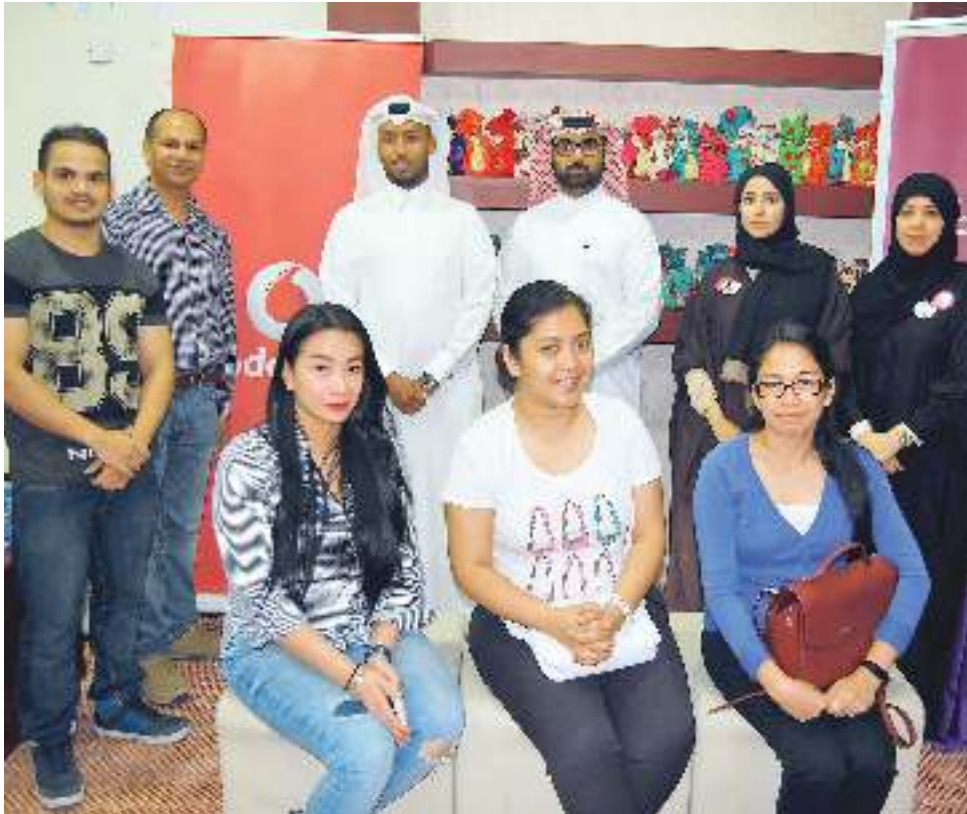
إدخال السعادة إلى قلوب المرضى من الأطفال والمسنين

الخاصة في هذا الشأن على منح الموظفين إجازة مدفوعة الأجر لمدة يومين، للمشاركة في الأنشطة التطوعية.