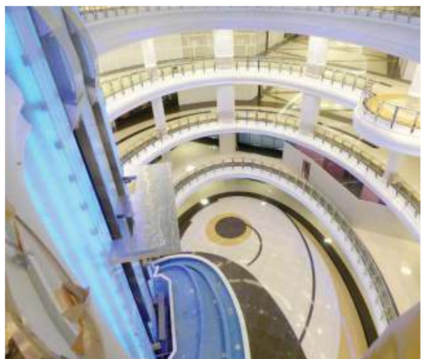
الافتتاح الرسمي لطوار مول، سيكون في اليوم الوطني