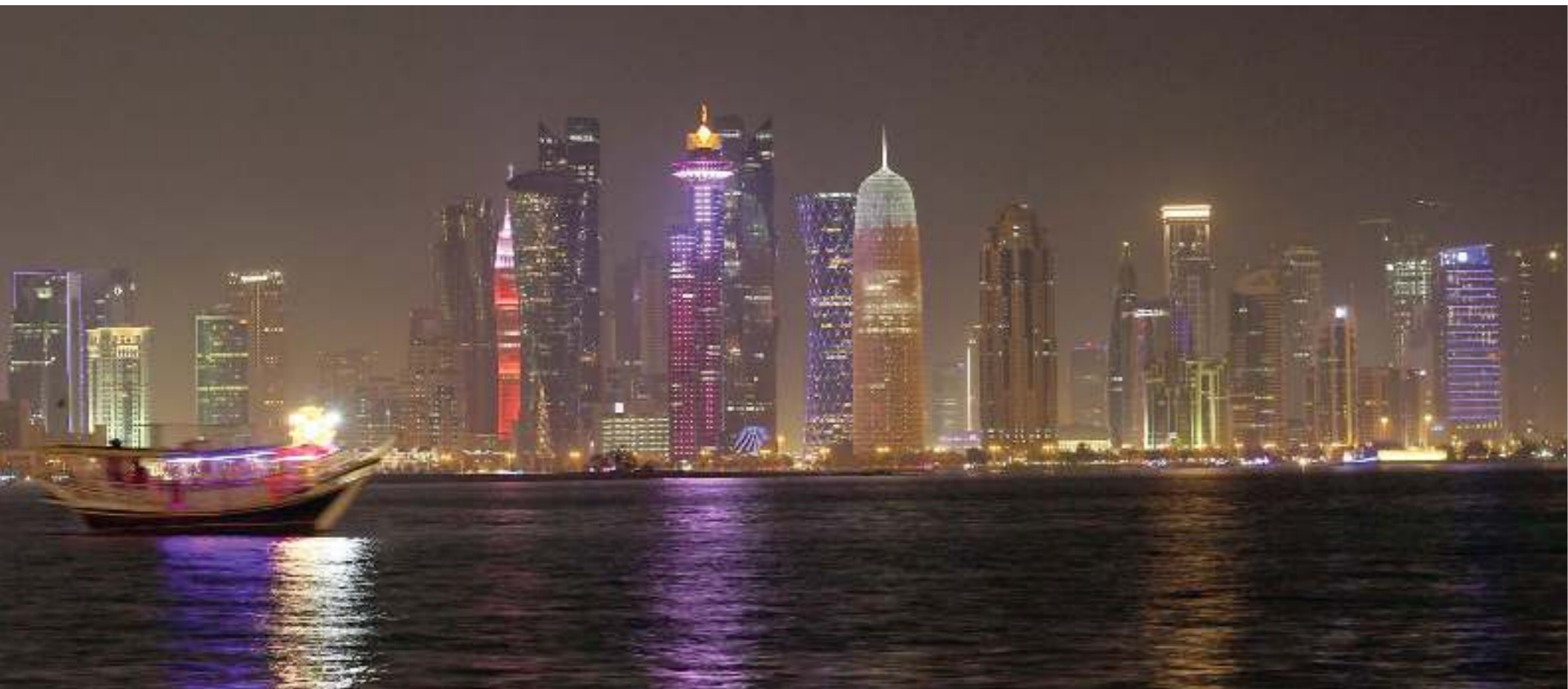
الدوحة ذات مكانة اقتصادية متقدمة

نحن لا نشعر بأي شيء سلبي، بل نرى أننا اليوم أمام أشياء إيجابية عديدة، هذه الأزمة أكدت لدينا فقط شيئاً واحداً، وهو الولاء التام لحضرة صاحب السمو الشيخ تميم بن حمد آل ثاني أمير البلاد المفدى، رأس الهرم في هذه الدولة، وقائد شعب قطر العظيم، الذي أبدى تضامنه الكامل مع حكومتنا، التي استطاعت أن توفر بعد هذا الحصار كل البدائل في أقل من نصف يوم، وكانت بدائل أفضل على مستوى الجودة وكذلك السعر، وخير ختام أختاره لكلامي ما أجمع عليه أسلافنا «ب ضارة أفاعه».