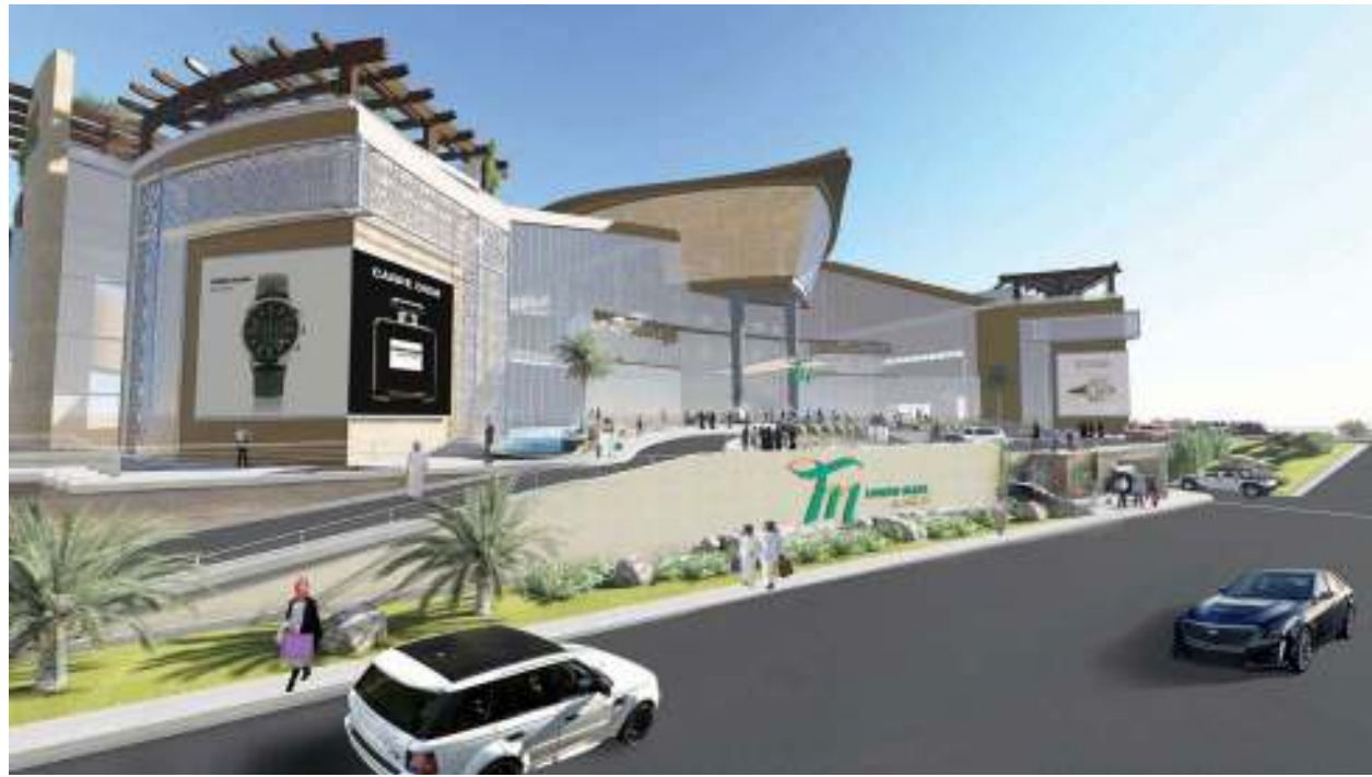
قرب افتتاح المول بنهاية الصيف

من العلامات التجارية للمول، لافتاً إلى أن الغرفة سوف تسعى لتنفيذ مبادرات مشابهة في مولات أخرى، بما يساعد