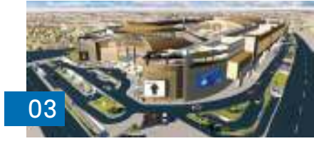
03 «غرفة قطر» و«طوار مول» يدعمان الصناعات الصغيرة والمتوسطة