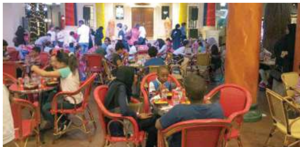
الخطوة تأتي في إطار برنامج «كيدز موندو الدوحة» للمسؤولية الاجتماعية

من 55 امتيازاً عالمياً في جميع أنحاء الشرق الأوسط وأفريقيا، والتي تعتبر شريكاً استراتيجياً لكيدز موندو الدوحة.