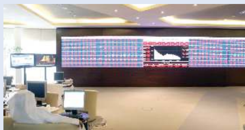
البورصة القطرية تكتسي باللون الأحمر

«الخليجي» بمعدل 2.5 % عند مستوى 13.35 ريال، تبعه سهم «ناقلات» بارتفاع قدره 2.3 % عند 17.54 ريال.