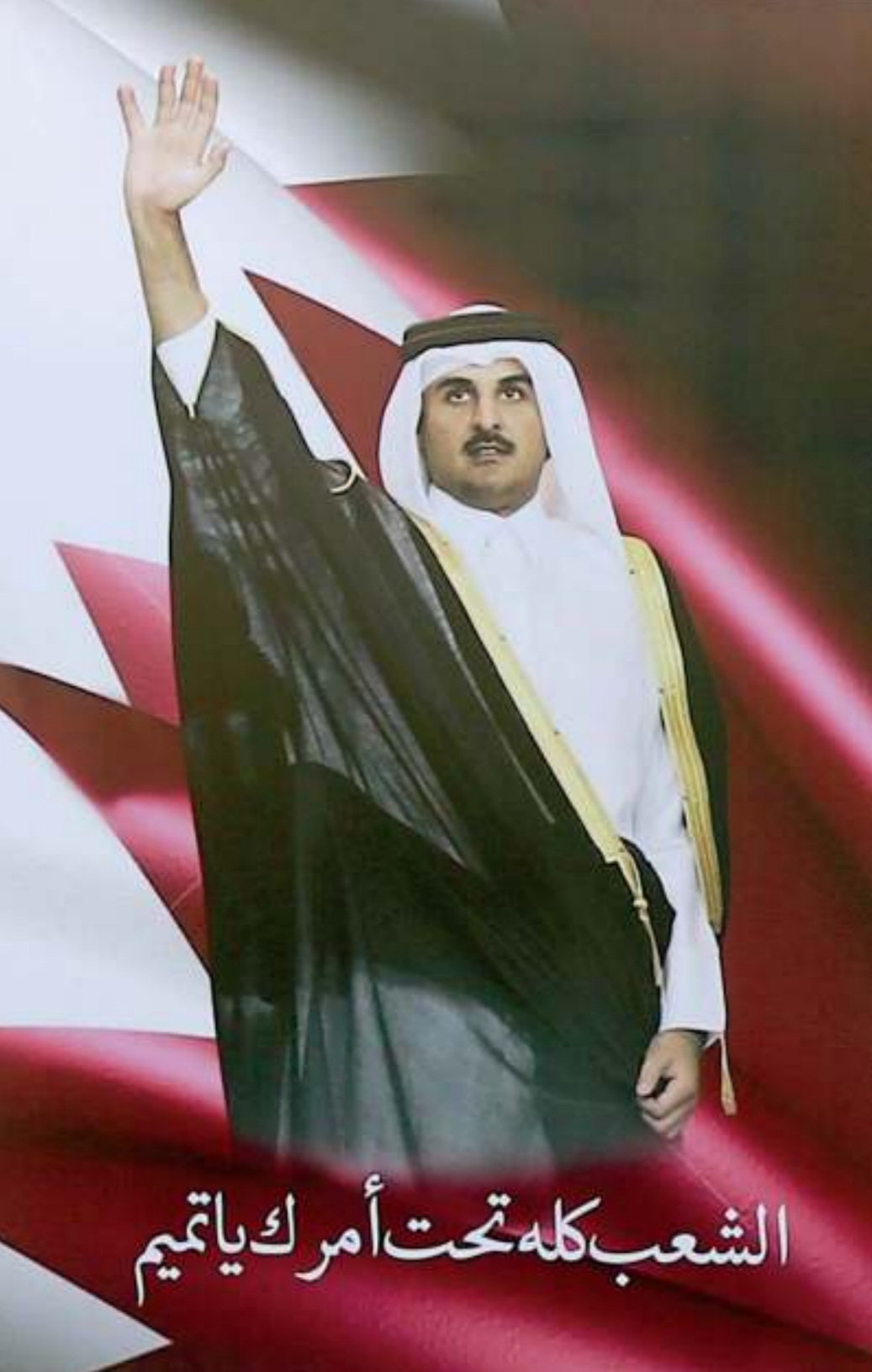
تلبية داء وتوجيهات القائد

هذه التجربة كشفت لنا الكثير، أولها كيف أن قيادتنا الرشيدة رسخت قواعد الاعتماد على النفس في جميع الأزمات، فالدولة اتخذت قرارات سريعة