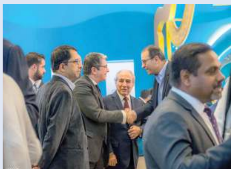
تقدير دعم العملاء

الفعاليات مستقبلاً للاحتفاء بمزيد من الإنجازات والبركات في ظل تقاليد قطر العريقة وشعبها العظيم». تعتبر فعاليات «سيب» الرمضانية جزءاً من المبادرات الاجتماعية التي تنظمها الشركة في إطار برنامجها للمسؤولية الاجتماعية، والذي يشمل جميع جوانب التنمية المجتمعية في قطر، بما فيها الاستدامة البيئية، التنمية الاجتماعية والثقافية والأعمال الإنسانية.