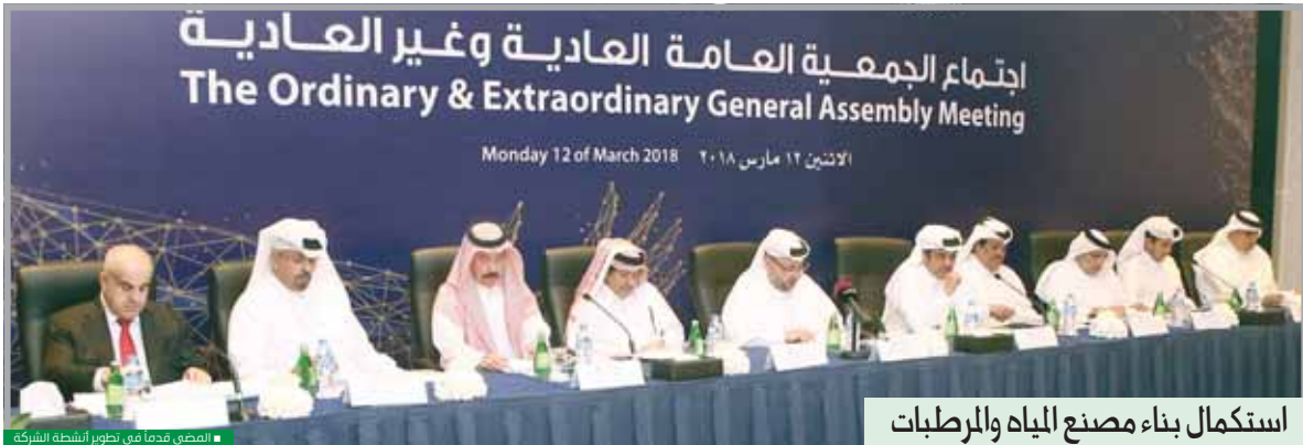
المصنع قديماً في تطوير أنشطة الشركة