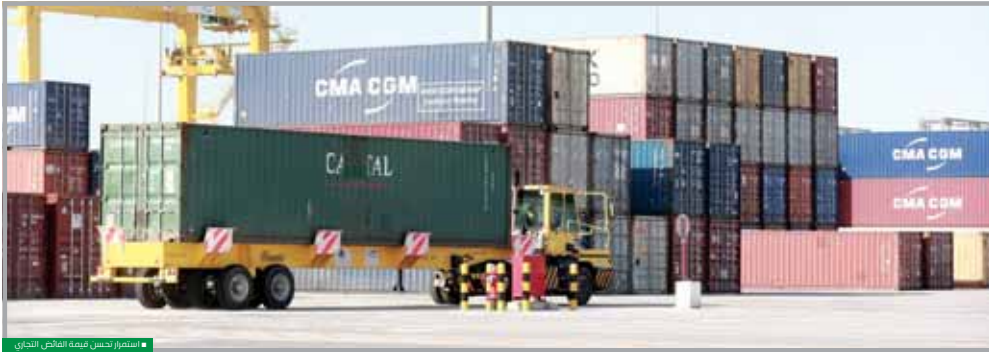
استمرار تحسين قيمة الفائض التجاري

وعلى الرغم من التحديات الالاقتصادية، سجل الخطر للمال زيادة سنوية نسبتها 66% في ترخيص الشراكات الجديدة خلال الفترة من 1 يناير 2017 إلى 31 ديسمبر 2017، ووصل العدد الإجمالي للشراكات المسجلة لشركة أوفغا لآبارفام المسجلة في 31 ديسمبر 2017، مقارنة بعدد 348 شركة مسجلة في نهاية شهر ديسمبر 2016، وهو ما يمثل زيادة نسبتها 30.5% على أساس سنوي، ويضم مركز قطر للمال حالياً 485 شركة مسجلة تحت مظلتها حتى تاريخ 1 مارس الحالي. وتزخر علاقات التعاون بين الجانبين، ولتوسيع نطاقها، وقد ودعنا الاجتماعات بفرصة مناقشة الطرق التي يمكنها من خلالها التعاون في مشاريع مشتركة، وبإضافة إلى ذلك، يُعقد Meeting معايير التوظيف التابع لمركز قطر للمال، أول مركز إداري لتسمية منازعات التوظيف في منطقة الشرق الأوسط وشمال إفريقيا؛ يعمل وفقاً لمعايير منظمة العمل الدولية.