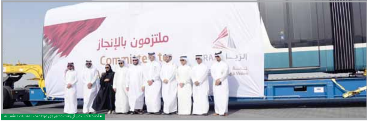
أصبحنا أقرب من أي وقت مضى إلى مرحلة بدء العمليات التشغيلية

طراز «سيتاديس» يصل ميناء حمد في الموعد المحدد