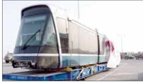
العمل يجري حالياً على قدم وساق لإتمام تجهيز المحطات

والجدير بالذكر أن تصميم «ترام لوسيل» مستوحى من شكل «المحمل»، وهو المركب الشراعي التقليدي القطري الذي كان يُستخدم في صيد اللؤلؤ. وقد ركز مفهوم التصميم على البحر متعللاً في صيد اللؤلؤ باستخدام الحمل، ليستمد منه عناصر السكون والهدوء والرقى، ويجسدها في تصميم «الترام». وسيصبح «ترام لوسيل» عصب النقل في مدينة لوسيل، التي تعد نموذجاً للمدينة العصرية التي تتبنى أرقى وأحدث معايير الاستدامة والتقنيات الصديقة للبيئة. وتجدر الإشارة إلى أن «ترام لوسيل» مرتبط بشبكة مترو الدوحة عن طريق محطتي تبايل هما: لوسيل ولطفيفة. وسيتم إطلاق شبكة ترام لوسيل، التي تمتد على طول 35.4 كيلومتراً، في العام 2020. وتشمل هذه الشبكة أربعة خطوط، و28 محطة على مستوى الأرض وتحت مستوى الأرض، وقد بلغت نسبة الإنجاز في المشروع حتى الآن 73%.