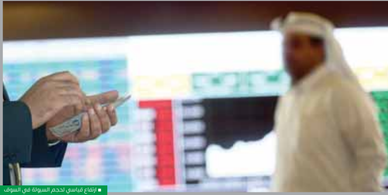
ارتفاع قياسي لحجم السيولة في السوق

الذات 8250 نقطة. وقفز حجم السيولة في السوق أمس إلى 871.54 مليون ريال، مقابل 125.22 مليون ريال بالجلسة السابقة. كما صدرت كميات الأسهم المتداولة إلى 17.87 مليون سهم، مقارنة بـ 5.36 مليون سهم يوم الأحد. مع العلم بأن بورصة قطر أجرت أمس تداولات على السندات والصكوك بنحو 256.6 مليون ريال، علماً بأنها تضاف إلى إجمالي التداولات. وشهدت البورصة ارتفاع مؤشرات 6 قطاعات، تقدمها الصناعة بـ 6.8 % ليغلق عند مستوى 2799.26 نقطة، لنمو 7 أسهم على رأسها «صناعات قطر» بـ 10%، و زاد مؤشر قطاع البنوك والخدمات المالية بنسبة 6.23 %، وارتفع مؤشر تداولات أسهم عند مستوى 2816.81 نقطة، بدعم ارتفاع عدة أسهم على رأسها سهم «QNB» المرتفع بـ 10 %، وبلغت قيمة التداول على سهم «QNB» 108.4 مليون ريال، موزعة على 859.9 ألف سهم، بتفويض 584 صفقة.