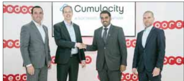
تعزيز مكانة «ooredoo» في مجال الاتصالات

أعلنت «ooredoo» يوم أمس، أنها ستعمل على تعزيز ابتكارات إنترنت الأشياء الخاصة بالشركات في قطر، وذلك من خلال الشراكة الجديدة التي أبرمتها مع شركة «Software AG» بخصوص نظامها «Cumulocity IoT» لإنترنت الأشياء. وستتمكن «ooredoo» من خلال استخدام نظام Cumulocity IoT من تطوير الحلول التي يمكن عملها من الشركات من دمج تصورات أدوات تحليل البيانات المتكاملة مع معدات التخزين، وأمن الأجهزة القابلة للترقية، وذلك لتطوير أعمال رقمية جديدة.