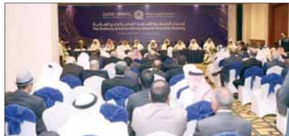
تداول بمستقل أعمال الشركة

تركيز الجهود لتطوير وإيجاد قوة عمل قطرية متميزة