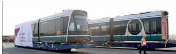
وصول أول قطار من قطارات ترام لوسيل

السيد جاسم بن سيف السليطي وزير المواصلات والاتصالات، وعدد من ممثلي الإدارة العليا في شركة الريل. ويهذه المناسبة، صرح المهندس عبدالله عبد العزيز السبيعي العضو المنتدب والرئيس التنفيذي للشركة - قائلًا: «نشهد اليوم محطة مهمة في مشروع ترام لوسيل، فبدء وصول القطارات يمثل