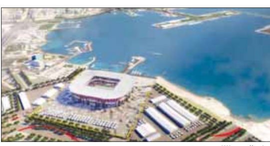
مشروع كاثي العام 2022 في طريقها للتأهق

وأشار سيتارامان إلى التحسن المستمر في ميزان المدفوعات بفضل تحسين الميزان التجاري، وزيادة الصادرات في الوقت الذي تراجع في الواردات بفضل