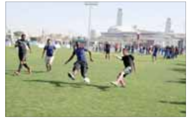
النشاط وفعاليات رياضية

أضاف سعادته: إن مشاركة وزارة المواصلة والاتصالات ثاني مجسداً لرؤية الشركة مع مختلف الجهات العاملة في مجال الشؤون الرياضية للمساهمة في أداء إنسان صحي قادر على المشاركة في مسيرة التنمية والبناء وتحقيق رؤية قطر الوطنية 2030 التي تعتبر الإنسان أهم ركائزها.