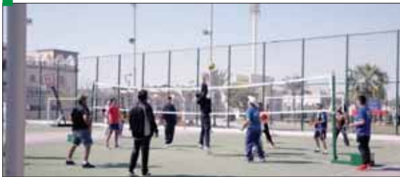
■ تقديم أنشطة مختلفة لموظفي شركة «قطر غاز» وعائلاتهم

وجرى أيضاً إقامة العديد من الأنشطة الرياضية لموظفي شركة قطر غاز وعائلاتهم الفعالية من جهود الشركة الرامية إلى تعزيز صحة وعافية الموظفين وأفراد المجتمع. هذا، وقد عقد عدد كبير من الفعاليات والأنشطة الرياضية بهذه المناسبة في نادي الخرافة الرياضي والملاعب والمرافق الرياضية بمجمع الخور السكني. وكان نادي الخرافة الموقع الرئيسي لفعاليات اليوم الرياضي لشركة «قطر غاز» في الدوحة، حيث بدأت الفعاليات بمسيرة المشي، حتى يتم التأكد من أن جميع المشاركين كانوا مستعدين لممارسة مجموعة واسعة من الأنشطة الرياضية المتوفرة. وبعد قطع مسافة كيلومترين سيراً على الأقدام، توجه المشاركون إلى المناطق العديدة المخصصة لرياضتهم المفضلة، وقد شملت الأنشطة العديد من الرياضات، مثل كرة القدم، والكرة الطائرة، وكره السلة، وتنس