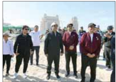
■ من مشاركة وزير الطاقة والصناعة في فعاليات اليوم الرياضي