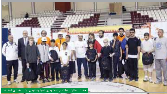
تعزيز فعالية كرة القدم للمكفوفين المبادرة الأولى من نوعها في المنطقة

2012، ظلت ساسول ملتزمة بتمكين ذوي الإعاقة ودعمهم، وهذه الشراكة مع برنامج «سيف ذا دريم» ومركز قطر للمال، ومركز قطر الاجتماعي والثقافي للمكفوفين، وأسباير زون، هي فرصة لتشجيع الرياضة الشاملة في البلاد، ونحن نتطلع على مزيد من التعاون مستقبلاً».