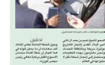
وزير المواصلة والاتصالات

«المواصلات» تستهدف إيجاد شبكة نقل لا مثيل لها في العالم