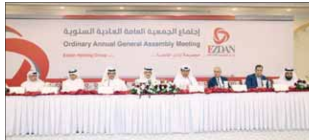
عمومية إزدان، تصادق على جميع البنود المدرجة على جدول الأعمال