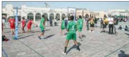
أنشطة مختلفة تنظمها وزارة الاقتصاد والتجارة

التنمية المستدامة. وأضاف أن احتفالات اليوم الرياضي لهذا العام تجسد عزم وإصرار الدولة على مواصلة نهجتها الاقتصادية الشاملة عبر