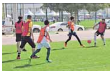
تظلمت الهيئة دورة في كرة القدم بتادي قطر الرياضي

منافسة قوية بين الإدارات الجمركية في مباريات كرة القدم