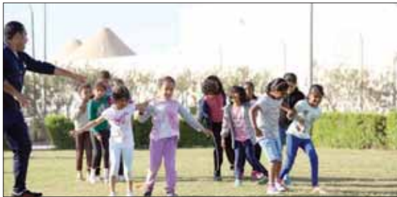
شكلت الفعاليات فرصة لجميع المشاركين للاستمتاع بيوم حافل بالنشاطات الرياضية

احتفالاً باليوم الرياضي للدولة، نظمت قطر للبترو مجموعة من الأنشطة الرياضية في منطقة دخان، والتي شهدت مشاركة فاعلة لعدد كبير من الموظفين وأسرهم. وقد شكلت الفعاليات فرصة لجميع المشاركين للاستمتاع بيوم حافل بالنشاطات الرياضية الممتعة وغيرها من الفعاليات التي تشجع على العديد من الممارسات الصحية. كما عملت