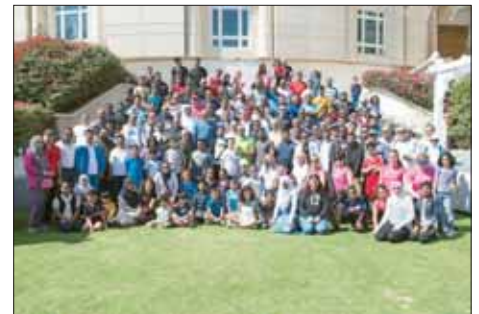
الإدارة التنفيذية مع موظفي «المصرف» في فعالية اليوم الرياضي

احتفل مصرف قطر الإسلامي «المصرف»، رائد الصيرفة الإسلامية في قطر، باليوم الرياضي للدولة بتنظيم مجموعة واسعة من الأنشطة الرياضية لموظفي المصرف وعائلاتهم، وأكدت هذه الأنشطة على أهمية اتباع نمط الحياة الصحي والنشاط البدني المستمر، وقد شارك في هذه الأنشطة أعضاء الإدارة التنفيذية والموظفون وعائلاتهم. وفي أنشطة هذا العام تعاون المصرف