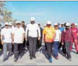
الإدارة العليا للبنك تشارك الموظفين في فعاليات المشي

ويعد هذا اليوم أيضاً فرصة للتقريب بين فئات المجتمع من خلال الرياضة، اعتماداً على المبادئ الرياضية، مثل: بناء روح الفريق، والوحدة، والاندماج، والمشاركة، واللياقة البدنية والصحية.