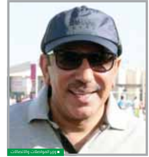
وزير المواصلة والاتصالات

احتفلت وزارة المواصلة والاتصالات، أمس، بالتعاون مع الطوط الجوية القطرية، ومشاركة الجهات العاملة في قطاعي النقل والاتصالات، باليوم الرياضي للدولة. شارك الوزيرة في الاحتفال كل من الهيئة العامة للطيران المدني، وهيئة تنظيم الاتصالات، وكلية قطر لعلوم الطيران، وشركة مواصلة (كروة)، والشركة القطرية لإدارة الموانئ (موانئ قطر)، وميناء حمد، وتم تنظيم أنشطة وفصاليات رياضية وترفيهية لجميع الموظفين وأسراهم. أكد سعادة السيد جاسم بن سيف السليطي وزير المواصلة والاتصالات، أن اليوم الرياضي للدولة يعكس رؤية القيادة الحكيمة في بناء الإنسان والمجتمع، حيث إن هذا اليوم رسالة مهمة لتكوين الرياضة جزءاً من ثقافة وحيات الفرد والمجتمع، وأحد أوجه الاستثمار في العنصر البشري، وتوه سعادتة بحرص الوزارة على المشاركة في اليوم الرياضي للدولة مع جميع الجهات المختصة في قطر النقل والاتصالات، بهدف تحقيق الوعي بأهمية الرياضة ودورها الهام في نهضة المجتمعات وتطورها، ودعم وتشجيع الجميع لممارستها، والمساهمة في جعلها منهجاً لحياتة صحية سليمة.