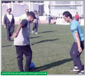
السعادة أوبر يشارك الموظفين في لعبة كرة القدم