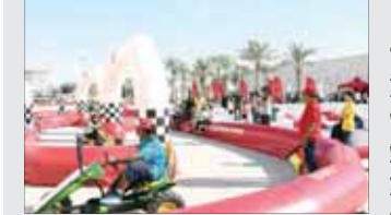
استقطبت «فودافون» الشباب والكبار للمشاركة في الأنشطة الترفيهية

«فودافون» تشجع الجمهور على اتباع حياة صحية