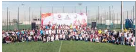
■ صورة جامعة لموظفي قطر غاز

احتفلت شركة «ناقلات» وشركاتها مشاريعها المشتركة باليوم الرياضي لدولة قطر لعام 2018، وذلك بتنظيم الأنشطة الرياضية المتنوعة. تهدف شركة «ناقلات» إلى حث موظفيها على ممارسة الأنشطة الرياضية الصحية، وذلك للتأكيد على أنه يمكن ممارسة الرياضة في أي وقت وفي أي مكان جري تقديم أنشطة مختلفة لموظفي شركة «ناقلات» وعائلاتهم، مثل كرة الطائرة، وكره القدم، وكره السلة، وتنس الطاولة، وغيرها من الأنشطة