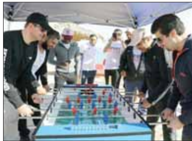
■ جانب من الفعاليات