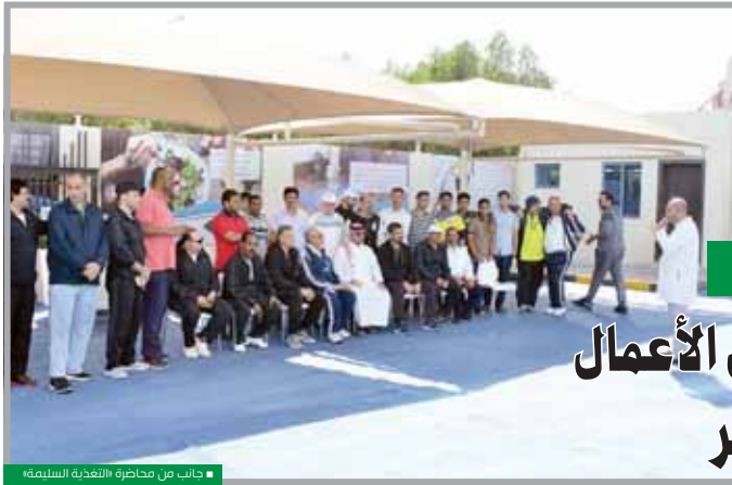
جانب من محاضرة «التغذية السليمة»

احتفلت غرفة تجارة وصناعة قطر، أمس الثلاثاء، باليوم الرياضي للدولة من خلال إقامة العديد من الفعاليات والأنشطة الرياضية، بمشاركة الإدارة العامة للغرفة وموظفيها وعدد من أعضاء مجلس الإدارة ورجال الأعمال ومنتسبي بيت التجار.