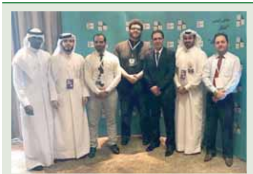
المشاركة في ملتقى الأوبر

اجتماعية مستدامة. وتمثل رؤية المركز في أن يكون مرجعاً للمسؤولية المجتمعية في قطر، ونموذجاً عالمياً يحتذى به من خلال النهوض بالأفراد والمؤسسات في مجال المسؤولية المجتمعية، وتكوين