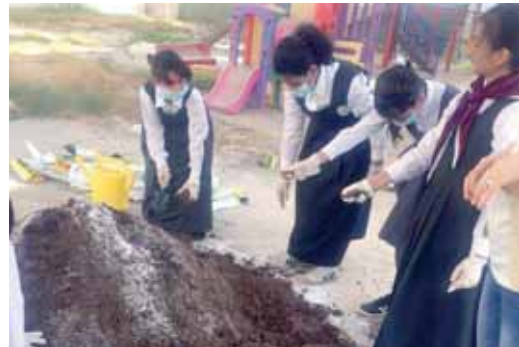
التدريب على عملية الزراعة